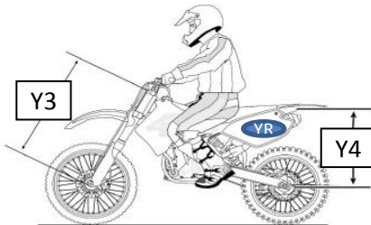
Moto avec pilote équipé+ plein